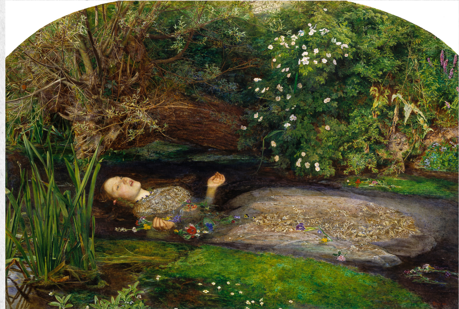
Ophelia . John Everell Millais. 1851. Tate Britain Museum

“If thou dost marry, I'll give thee this plague for thy dowry: be thou as chaste as ice, as pure as snow, thou shaltnot escape calumny. Get thee to a nunnery, go.”