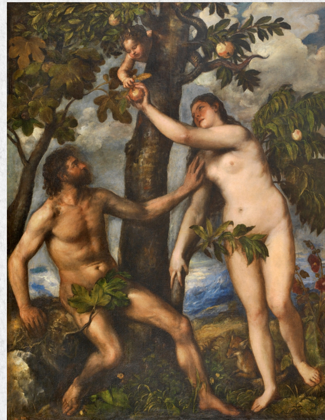
Adán y Eva en el paraíso terrenal. Tiziano. 1550. Museo del Prado.