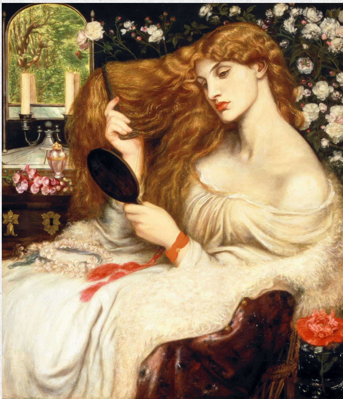
Lady Lilith. Dante Gabriel Rossetti. 1866-1873. Museo de Arte de Delaware.