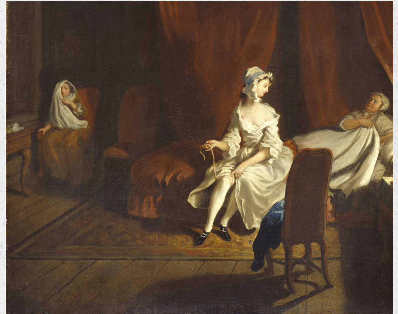
Pamela in the bedroom with Mrs. Jewkes and Mr. B. Joseph Highmore. 1741-1743. Galería Nacional de Arte Británico

"You are so pretty, that, go where you will, you can never be free from the designs of some of our sex."