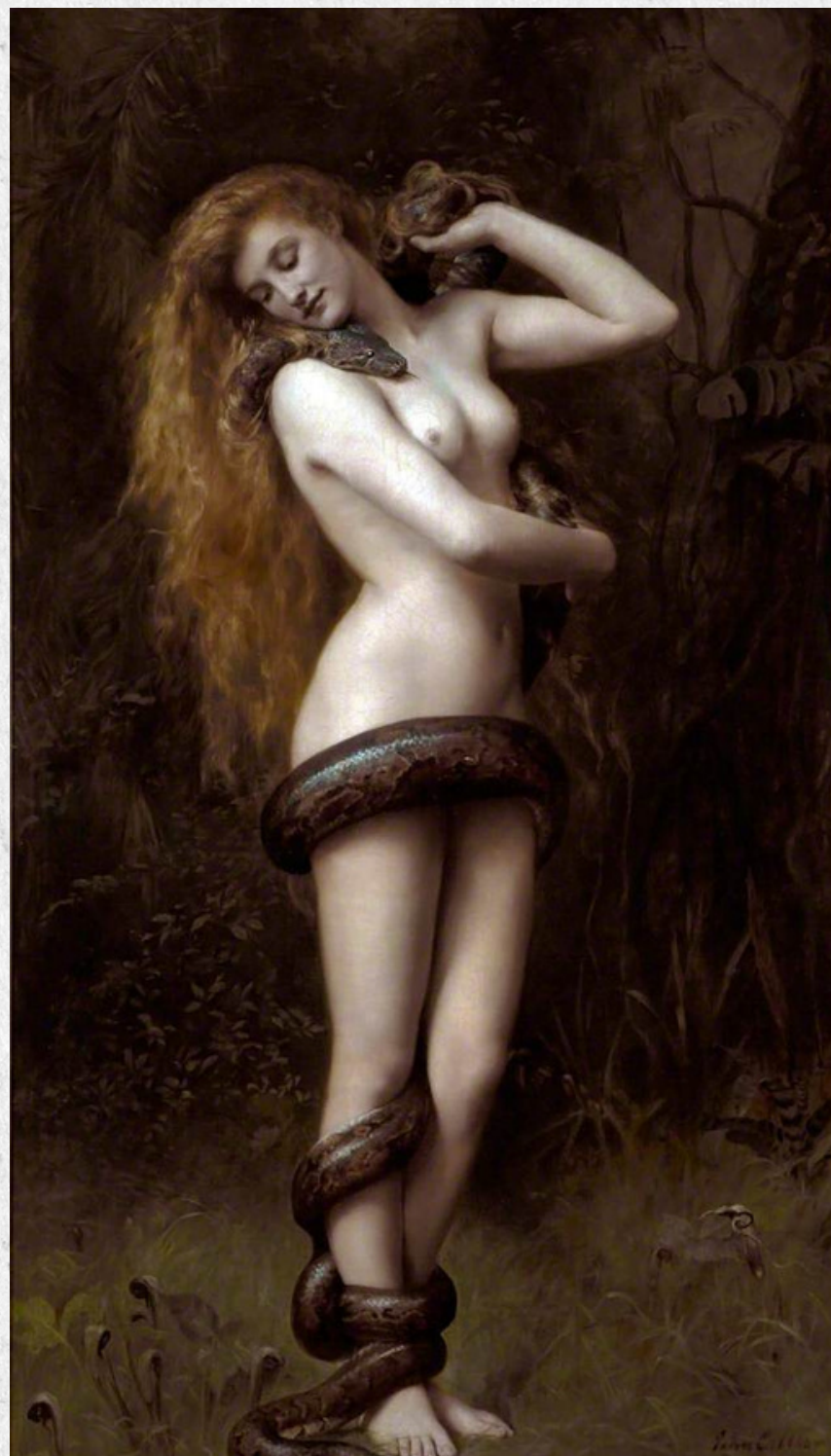
Lilith. John Collier. 1889. Atkinson Art Gallery, London