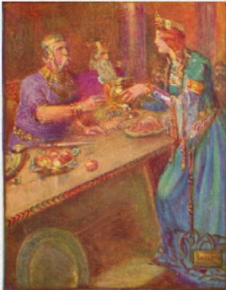
Hroðgar y su consorte, la reina Wealhþeow. J.R. Skelton. 1908