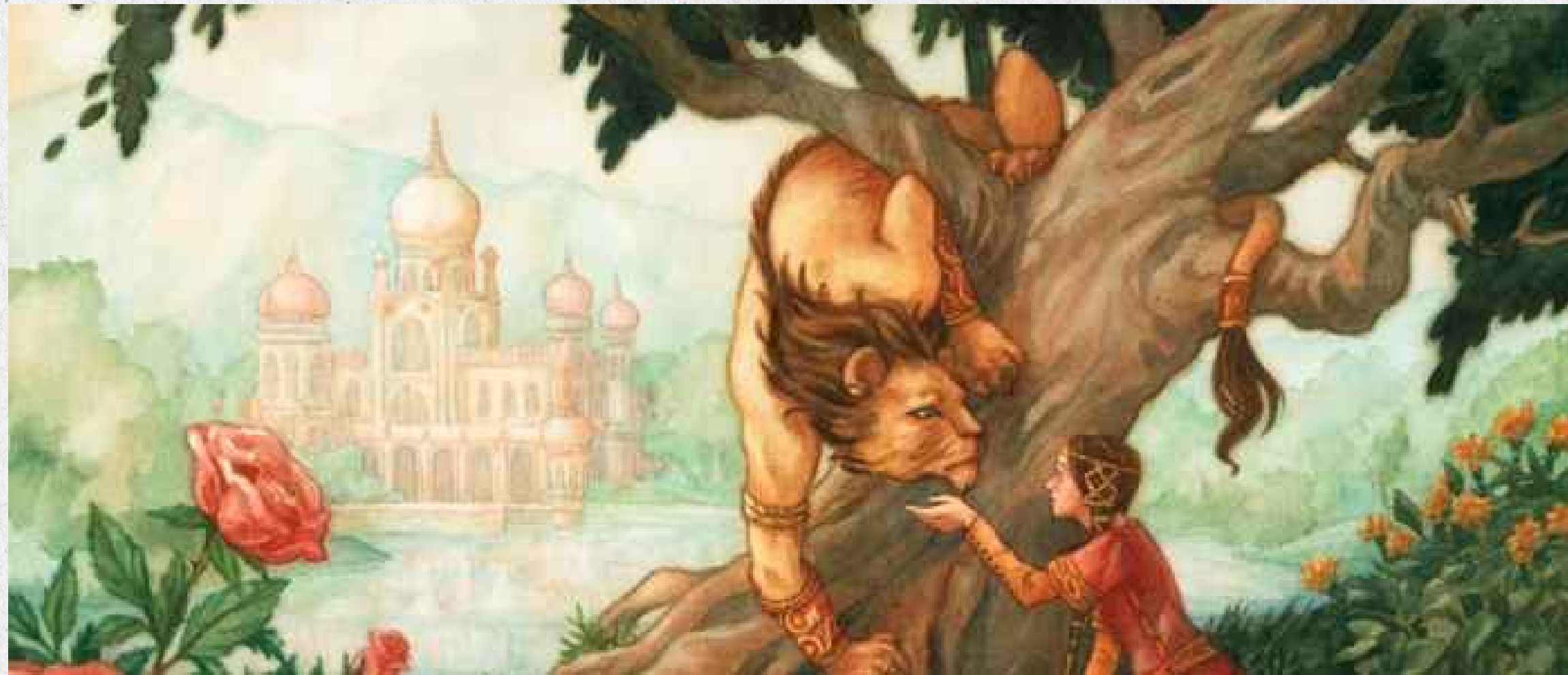
The Beast is often in the form of a lion. Illustration by Elisabeth Alba.