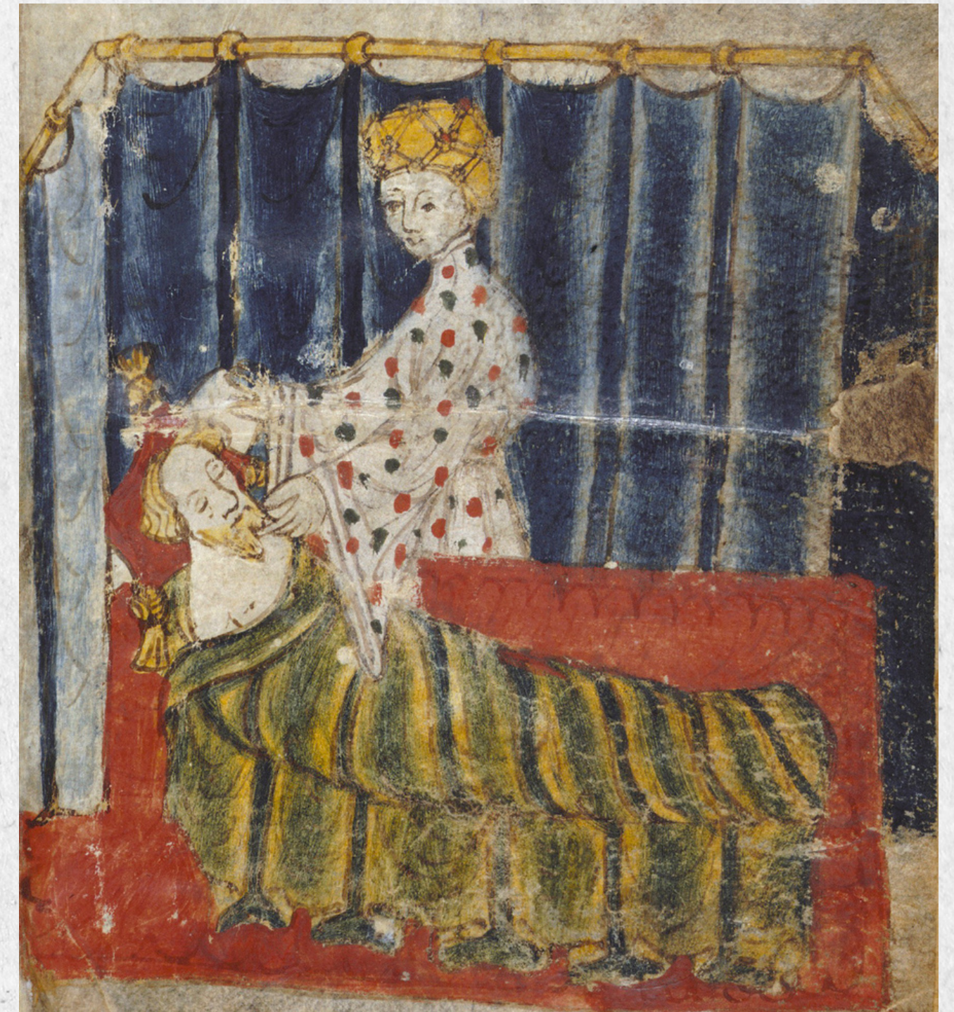
Temptation of Sir Gawain by Lady Bertilak..SXIV